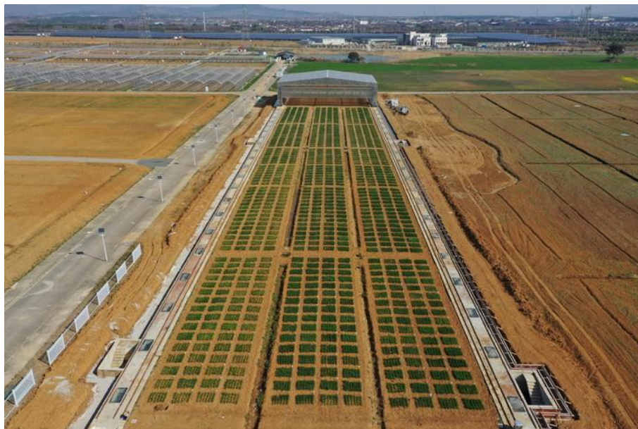
图 5：田间大型移动表型舱

目前，基地作物表型组学整体技术已经达到国际一流水平，可快速高效的监测作物表型、筛选作物品种，实现育种过程的设计性、预见性和可控性。