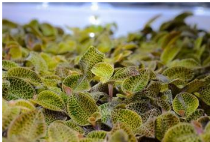
图 2：高附加值中草药植物工厂栽培