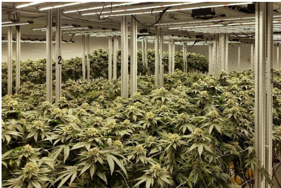
图 3：药用大麻植物工厂商业化生产