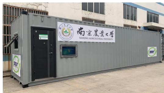
图 6：集装箱式移动表型舱