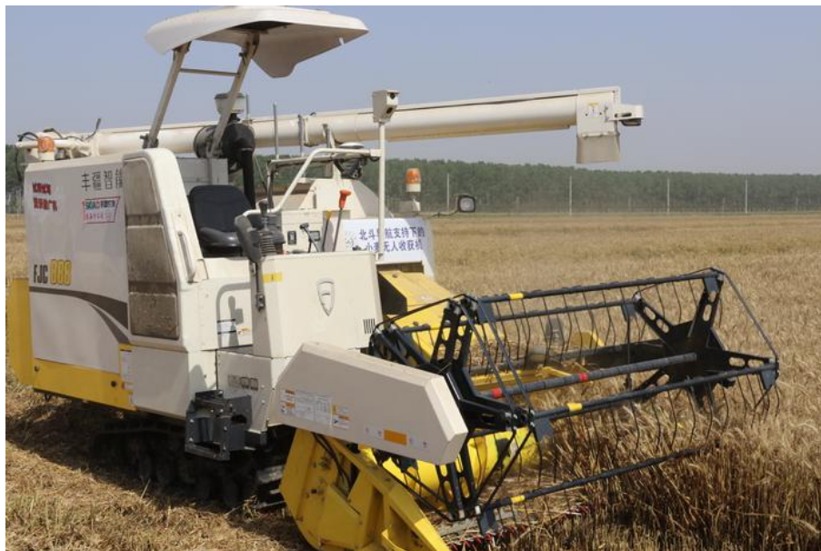
图 1：北斗导航支持下的智慧麦作技术

“北斗导航支持下的智慧麦作技术”作为 2020 年农业农村部十大引领性农业技术，主要包括小麦无人播种收获技术支持下的小麦精确施肥喷药技术，以及物联网支持下小麦智慧灌溉技术等。通过对稻麦籽粒品质/水分检测，构建作物管理知识模型，建立基于模型的作物生产管理决策系统，依托北斗导航支持下的变量播种机、无人驾驶收割机，实现对小麦的精准种植与精准收获。通过构建集信息采集、差异分析、处方生成、路径规划、无人作业等功能为一体的智慧麦作技术，实现了对小麦耕、种、管、收全过程的精确化、智慧化管理。